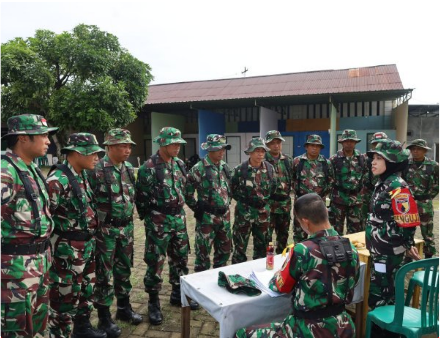
Tingkatkan Kemampuan Prajurit, Kodim 0804/Magetan Gelar UTP Teritorial

Magetan. Guna meningkatkan kemampuan Prajurit, Kodim 0804/Magetan menggelar kegiatan Uji Terampil Perorangan (UTP) Umum teritorial, di Taman Darmawangsa Kodim 0804/Magetan, Rabu (22/01/2025).